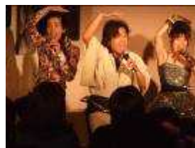
ダンドン×カンパニー