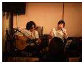
音心譜通のお二人

最後は出演者全員による「上を向いて歩こう」。美味しい料理とお酒、そして楽しい音楽の余韻がいつまでも残る夜でしたzzz。