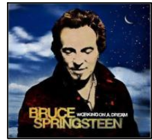
Working on a Dream

5年ぶりに長年の盟友E.ストリートバンドと組んだ前作 『Magic』からわずか1年で、再び同バンドを従えた 『Working on a Dream』を発表！ その直後に行なわれた先日の スーパーボウルのハーフ・タイ ムショーでは、圧巻のライブパ フォーマンスを見せつけてくれ ました。うーん、さすがは「ポス」！ しかし、現在の絶好調の呼び水 となったのは、むしろ『Magic』の 前年(2006年)に発表された、トラ ディショナル・フォークカバー 集『We Shall Overcome』で あったように、僕は思います。 バンジョーにプラスやフィドル (弦楽器)…。E.ストリート・バ ンドとはまた違う趣の大所帯 のバンドと共に、痛快で楽し げなニューオリンズ・サウンド が繰り広げられるこのアルバム は、まさにオーガニック。 大地の匂いが伝わってくるようです。We Shall Overcome 自身のルーツを再確認したことが、きっとその後の 大きなモチベーションにつながったんですね。