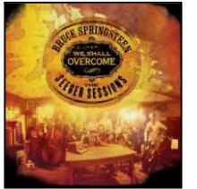
We Shall Overcome