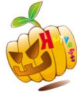
Illust by 大内